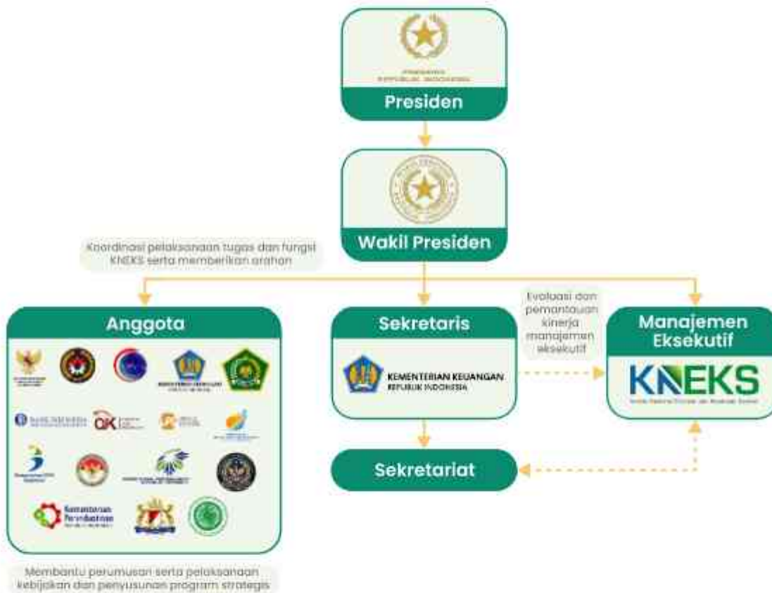
Gambar 3. Struktur Kelembagaan KNEKS

Dalam rangka peningkatan pembangunan ekosistem ekonomi dan keuangan syariah guna mendukung pembangunan ekonomi nasional, maka pada awal tahun 2020 pemerintah memutuskan melakukan perubahan Komite Nasional Keuangan Syariah (KNKS) menjadi Komite Nasional Ekonomi dan Keuangan Syariah (KNEKS). Dengan demikian secara kelembagaan KNEKS mengalami perluasan cakupan pengembangan dari hanya keuangan syariah menjadi ekonomi dan keuangan syariah sebagaimana yang tertera pada Peraturan Perpres No. 28 Tahun 2020. Dalam struktur kelembagaan yang baru, KNEKS diperkuat dengan menetapkan Wakil Presiden sebagai Wakil Ketua dan Ketua Harian serta Menteri Keuangan sebagai Sekretaris (Gambar 3).